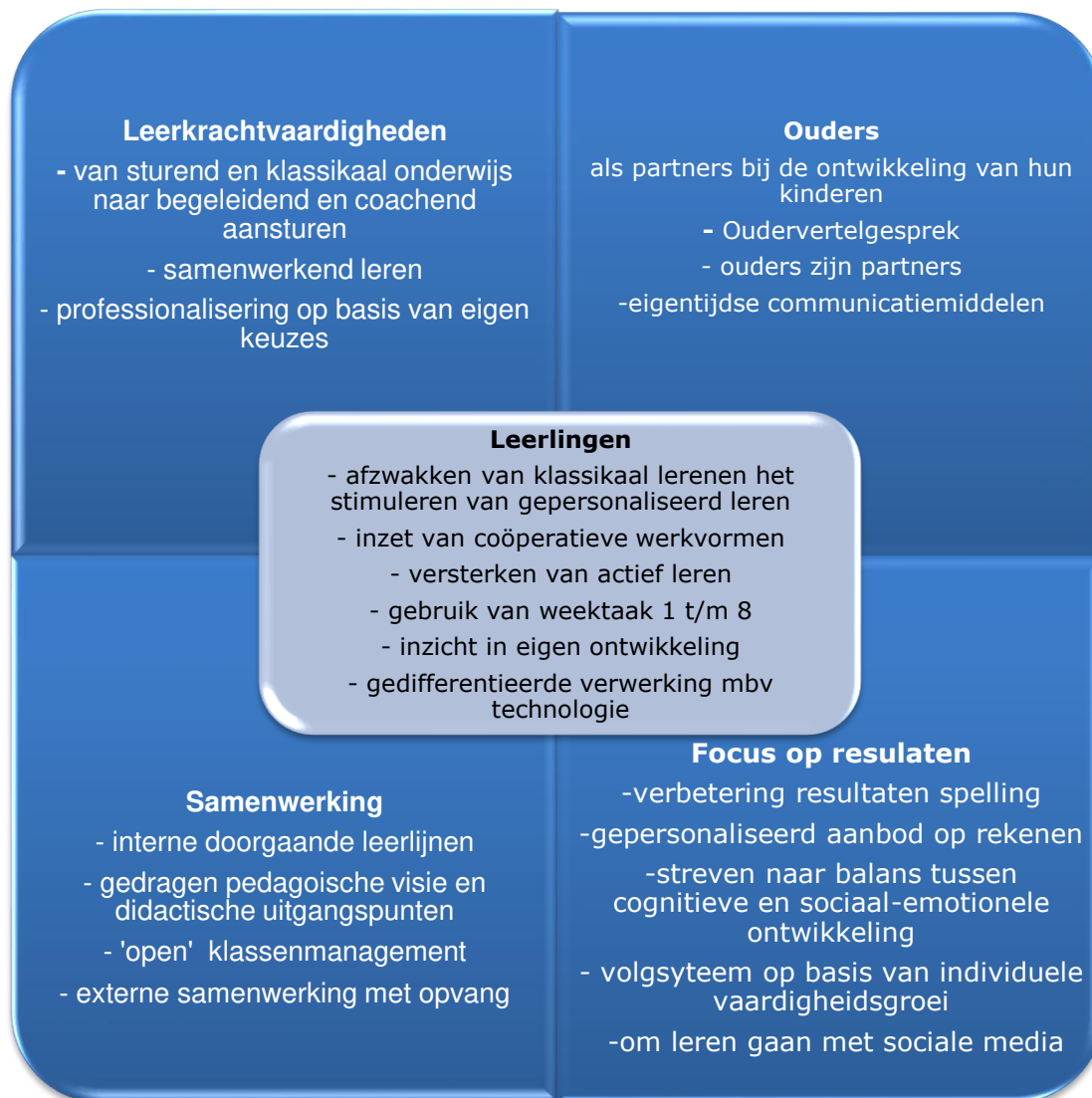
Bijlage 1 ; Activiteitenkalender